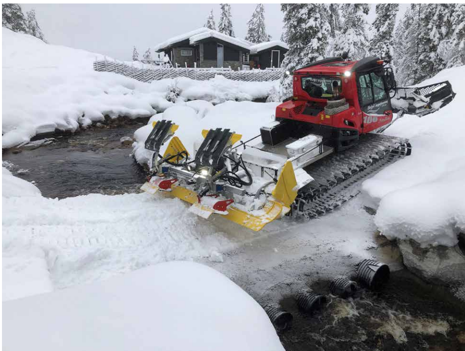
NY BRU: Det er bygd ny bru over elva mellom Sandvatnet og Mjovatnet.