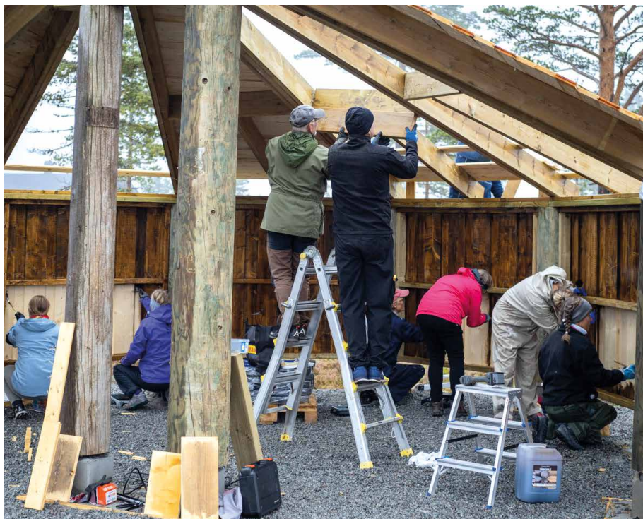
NY GAPAHUK: Ved hjelp av dugnad og 40 000 kroner i tilskudd fra Stiftelsen Blefjell har Åsland Fjellgrend Øst Vel fått ny gapahuk.

Se på dieselprisen som blei sett på som hårreisende da den steg seg opp mot 20 kroner. Etter at prisen har vært over 25 kroner løper vi til pumpene når den igjen koster 20 kroner.